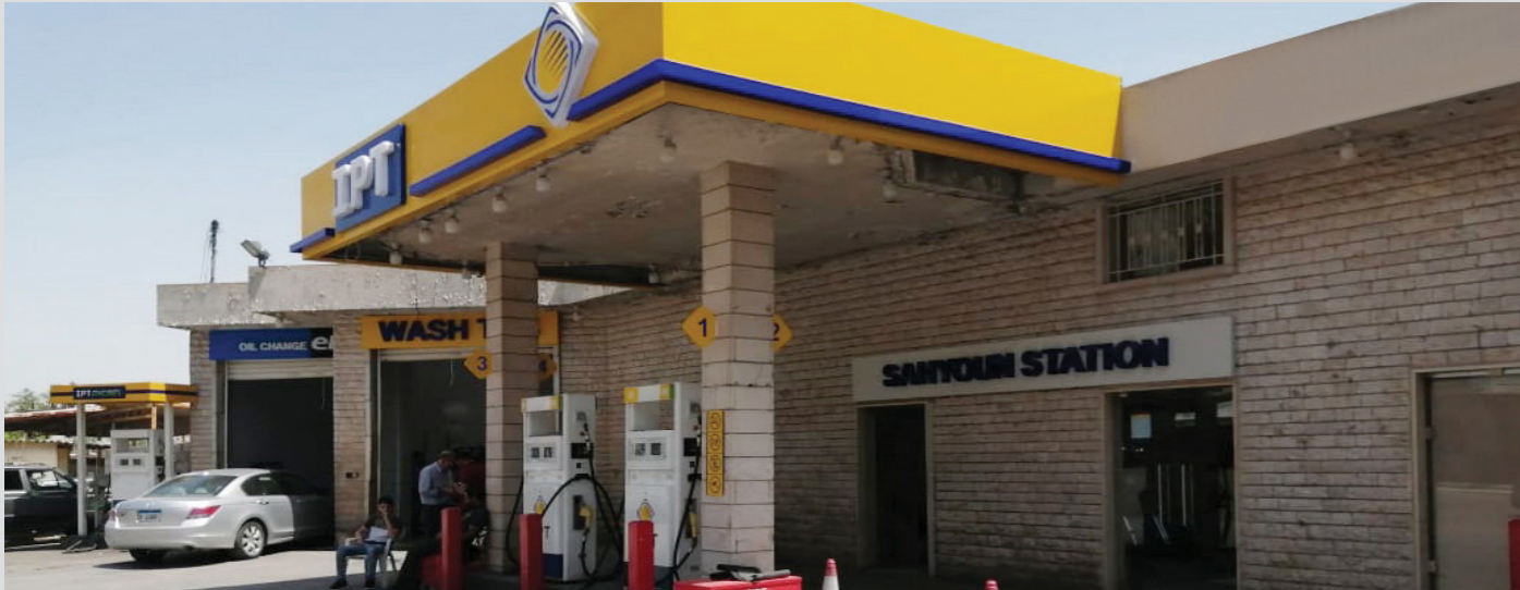
محطة صهيون - زحلة المعلقة - قضاء زحلة