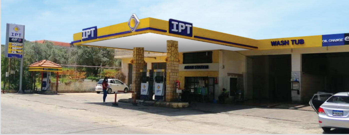
محطة الأمان - كفر كلا - قضاء مرجعيون

رغم التّحديات، تستمرّ أي بي تي بالتوسّع في انتشار شبكة محطاتها لتبقى قريبة من زبائنها أينما وُجدوا. تعرّفوا على مواقع المحطات الجديدة: