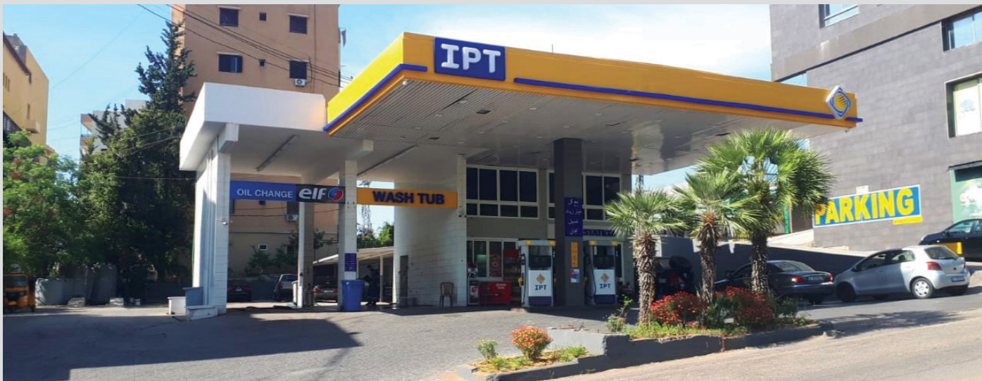
محطة جبيل - قضاء جبيل، (بإدارة السيّد جيلبار أسعد)